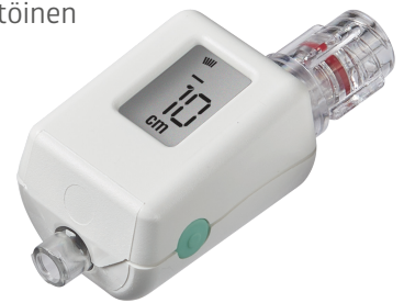
Compass pleurapunktion CTHR002-INT

Lisätietoja saa ottamalla yhteyttä Medline-tuotepäällikköön tai käymällä sivustollamme osoitteessa: uk.medline.eu