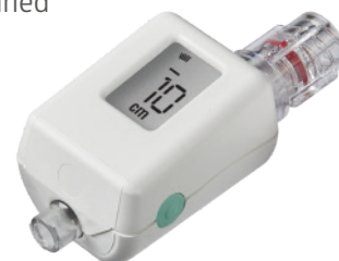
Compass thorakocentese CTHRO02-INT

Få mere information om dette produkt hos din Medline salgsrepræsentant eller gå til www.medline.eu/uk