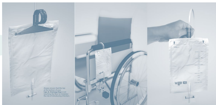
Forpakning: Gjenvinnbar, ikke-klorbehandlet kartong